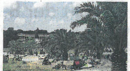
Auf der Theresienwiese soll es wie im vergangenen Jahr wieder einen Palmengarten geben.