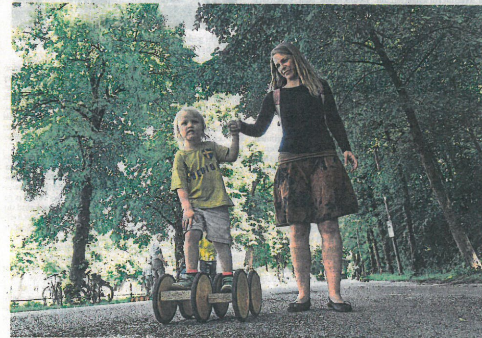
Die Südliche Auffahrtsallee zwischen Nymphenburger Straße und Waisenhausstraße ist seit Freitagnachmittag offiziell eine Spielstraße.

Wie berichtet, gibt es auch heuer Volksfestgefühl in München. Ab Mitte Juli bis Ende August werden wieder Gastro-Stand und Fahrgeschäfte an Münchner Plätzen (beispielsweise Königsplatz, Olympiapark) Station machen. Genauere Planungen